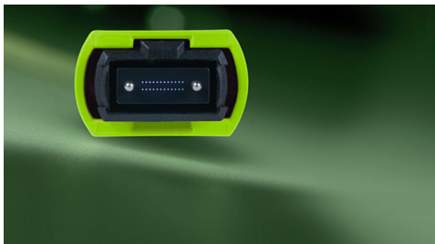
Bild 1: Strategischer Steckverbinder mit Zukunft: Ein 24-Faser-MPO-Steckverbinder

MPO-Steckverbinder sind die strategischen Steckverbinder der Zukunft. Angesichts rasant wachsender Nachfrage nach immer höheren Bandbreiten bieten sie in Verbindung mit skalierbaren Verkabelungssystemen investitionssichere Perspektiven für Highspeed-Übertragungen. Grund genug, sich in einem mehrteiligen Kompendium ausführlich mit der Mehrfasertechnologie auseinanderzusetzen. Der erste Teil erläutert aktuelle MPO-Technologietrends, zeigt auf, wo die Steckverbinder zum Einsatz kommen und welche Vorteile sie bieten.